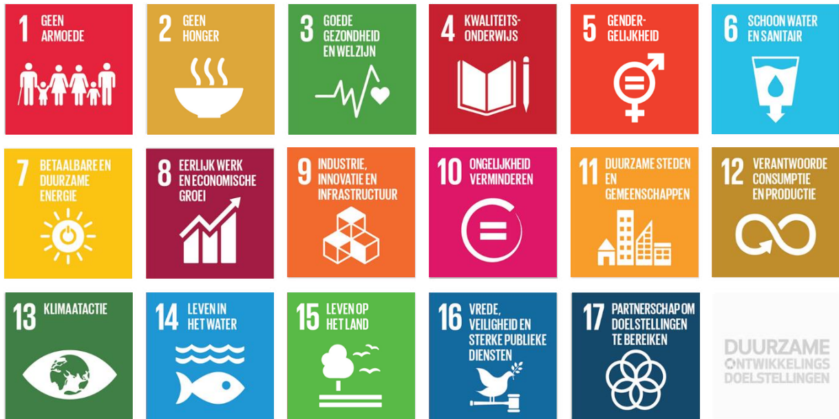
Afbeelding 1: Global Goals i.r.t. "Accommodatiebeleid"

Vrijwel alle Global Goals raken direct of indirect het beleid van de gemeente Beekdaelen. Om onze (beleids)doelstellingen in ruimtebehoefte te faciliteren stelt de gemeente haar eigen vastgoed ter beschikking. In het accommodatiebeleid staat omschreven hoe wij omgaan met ons maatschappelijke vastgoed en welke rol wij vervullen. Aangezien het hebben van vastgoed geen doel op zich is maar een middel om andere doelen te faciliteren ondersteunt ons vastgoed alle Global Goals. Indien van toepassing geven wij per beleidsterrein aan hoe wij ons vastgoed inzetten.